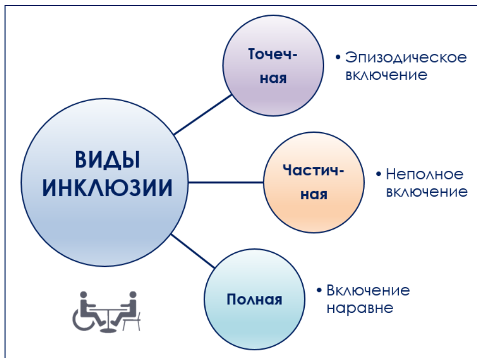
Рис. 31.4. Виды инклюзии в обучении

реализуются со всем классом. А по остальным предметам дети занимаются отдельно. При этом для лиц с ОПФР занятия проводит учитель-дефектолог. В III-V классах рекомендуется проведение учебных занятий со всеми учащимися класса, которые проводят различные учителя и учитель-дефектолог. Кроме этого, с лицами с ОПФР проводятся коррекционные занятия.