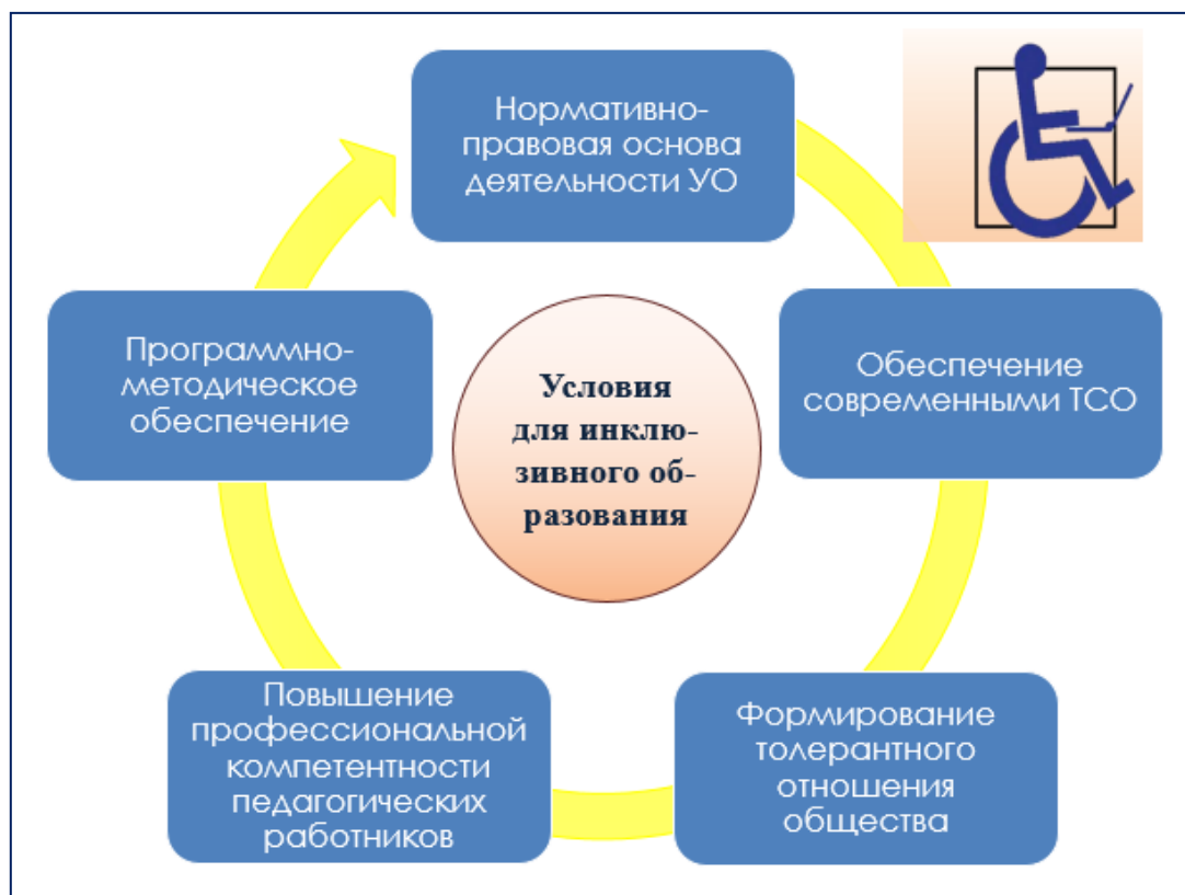
Рис. 31.2. Условия для инклюзивного образования

Условия для инклюзивного образования представлены на схеме рис. 31.2.