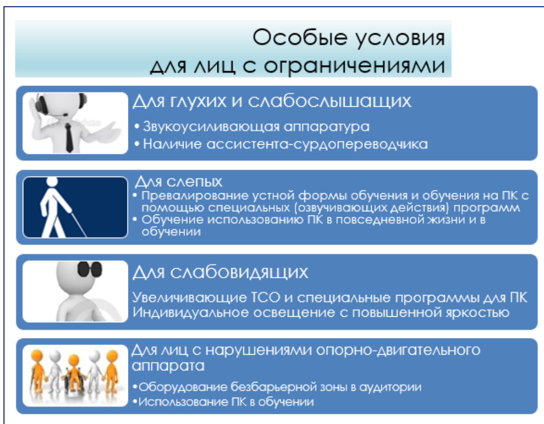
Рис. 31.3. Особые условия для лиц с ОПФР

В связи с этим необходимо отметить, что в настоящее время инклюзия в образовании рассматривается как (рис. 31.4):