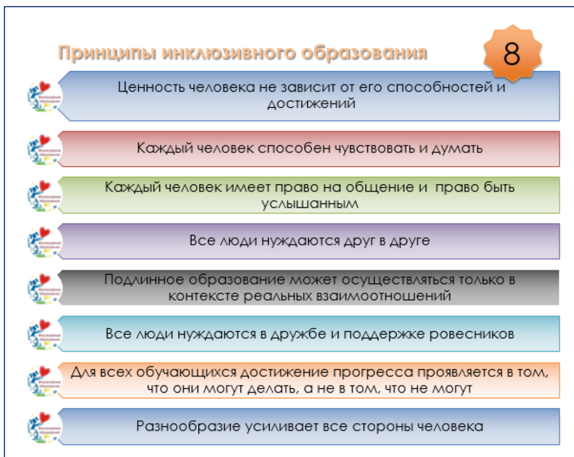
Рис. 31.1. Принципы инклюзивного образования

Принципы инклюзивного образования представлены на рис. 31.1.