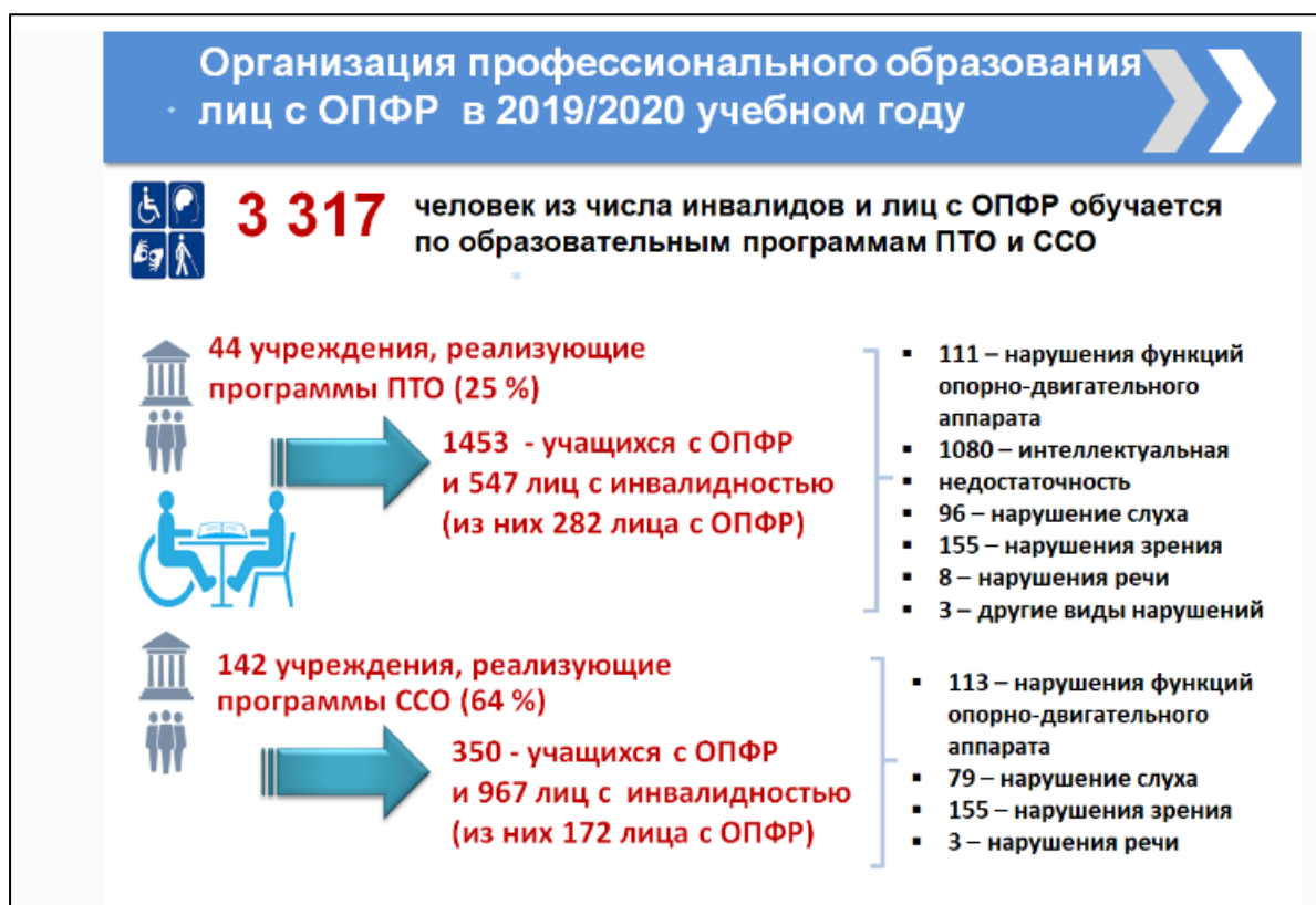
Рис. 31.5. Схематическое изображение статистической информации по обучению лиц с ОПФР в системах ПТО и ССО (по информации сайта РИПО)