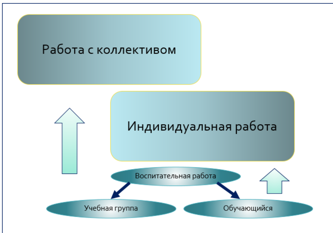
Рис. 29.1. Схема воспитательной работы в учреждении образования

Коллектив – развивающаяся социальная система. Учебный коллектив: