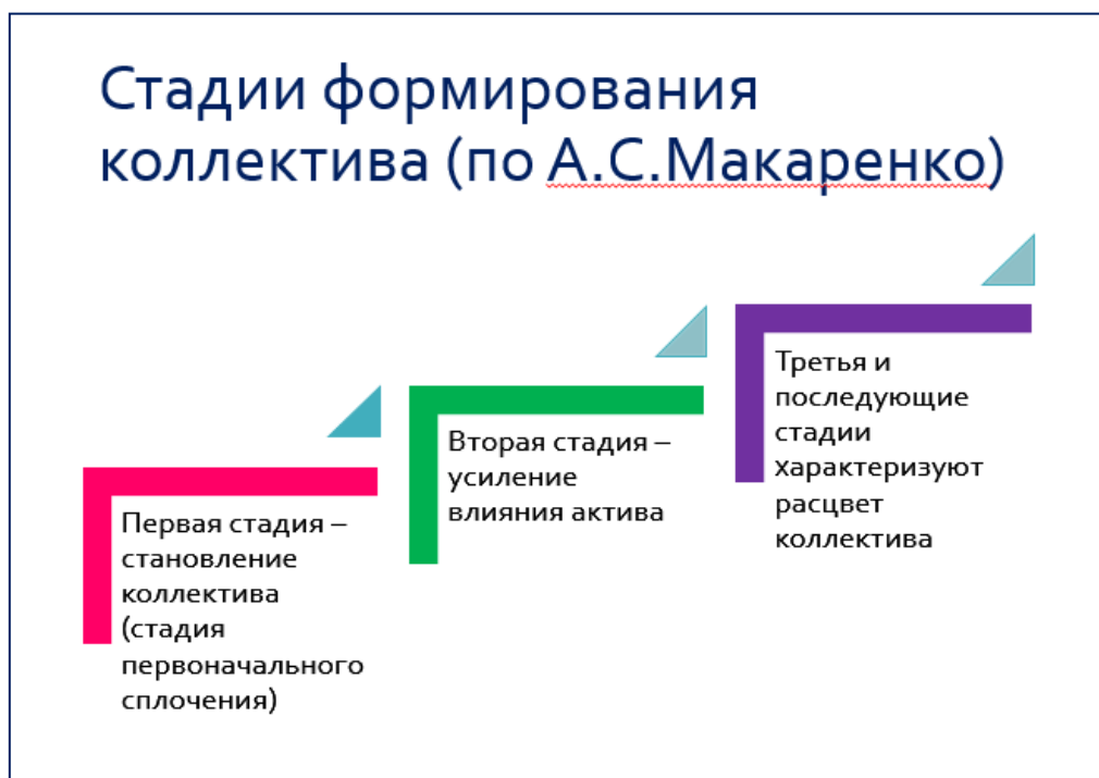
Рис. 29.2. Стадии формирования коллектива (по Макаренко А.С.)

А. С. Макаренко выделил 3 стадии формирования коллектива, представленные на рис. 29.2.