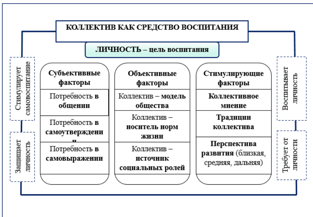
Рис. 29.4. Характеристики коллектива

Для качественной работы куратора ему нужно ознакомиться с информацией об учащихся, доступной в журнале куратора (она, как правило, является конфиденциальной), собрать недостающую и заполнить в соответствующих разделах журнала. Но очень важно также провести диагностику коллектива ученой группы. При этом широко используется метод социометрии.