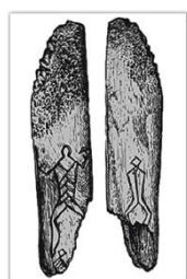
Изображения на кости. Озеро Вечера Любанского района

Самые ранние памятники искусства на территории Беларуси известны со времен палеолита. Это нанесение человеком орнамента на предметы. На стоянке в Юровичах археологи нашли обломок бивня мамонта, украшенный сочетанием зигзагов, шестиугольников и горизонтальных черточек. Также в палеолите человек начал изготавливать украшения. Для этого использовались зубы животных, раковины с просверленными отверстиями, костяные трубочки.