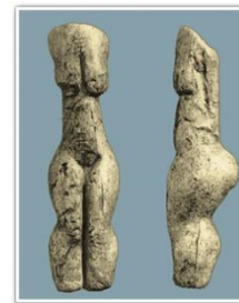
Женская статуэтка из бивня мамонта. Елисеевичи

В эпоху палеолита интеллектуальное развитие древних людей достигло такого уровня, когда возникает необходимость в определенных ощущениях и взглядах, позволяющих создать представление о картине мира и объяснить место человека в нем. В этот момент появились религиозные верования и первобытное искусство.