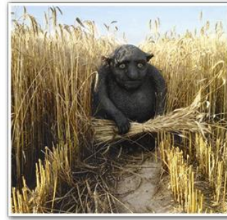
Скульптуры Жевжика, Злыдня и Евника, созданные на основе иллюстраций современного белорусского графика Валерия Слаука. Скульптор Антон Шипица