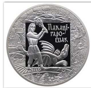
Памятная монета Национального банка Республики Беларусь. 2009 г.

Многие мифы у белорусов посвящены душам умерших предков — дедам. Существуют мифы, в которых отражены древние верования о наших предках в облике животных. Управляли миром старшие боги. За ними стоял ряд низших божеств и духов, которые были у старших в услужении. Каждый из богов и божеств имел свое предназначение и определенным образом влиял на жизнь человека. Белорусы одинаково почитали и добрых, и злых богов, но отдавали предпочтение первым за их «человечность», приближенность к людям.