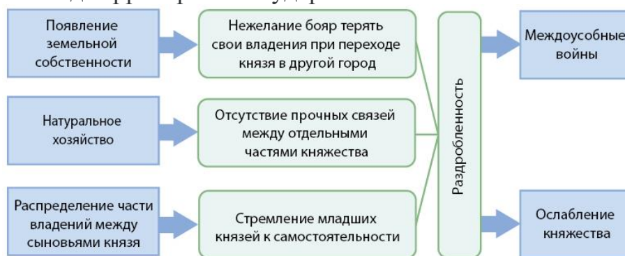
Раздробленность на белорусских землях

Раздробленность — это система удельных княжеств с самостоятельными княжескими династиями. Распад Киевской Руси на отдельные княжества был обусловлен развитием феодальных отношений и укреплением отдельных городов как феодальных центров. В условиях господства натурального хозяйства отсутствовали прочные, постоянные экономические связи между землями. Также нарушилась практика передачи княжеского престолонаследия. В результате некоторые князья начали усобицы из-за главенства, втягивая в военные действия других князей. Постепенно центральная власть ослабевала. Статус главного города в княжестве стал зависеть больше от церковного, а не политического контроля над территорией государства.