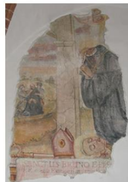
Согласно легенде, Бруно из Кверфурта был убит на границе Руси и Литвы

В конце X — начале XI в. христиане активно вели миссионерскую деятельность к востоку от Рима. В 1009 г. в Кведлинбургской летописи было зафиксировано убийство «на границе Руси и Литвы» католического миссионера из Кверфурта Бруно. Точное место, где это произошло, не может быть определено.