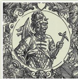
Князь Витень. Из хроники Александра Гваньини. 1578 г.

Проведите исследование и определите историю названия герба ВКЛ. Какие легенды о происхождении «Погони» вам известны?