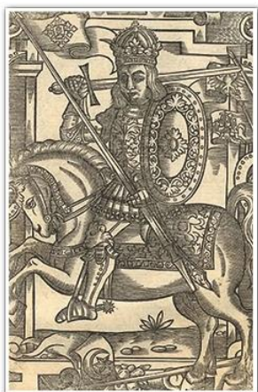
Портрет Миндовга. Из хроники Александра Гваньини. 1578 г.

О каком событии свидетельствует данный фрагмент летописи?