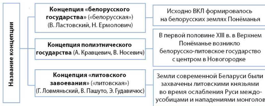
Концепции образования ВКЛ