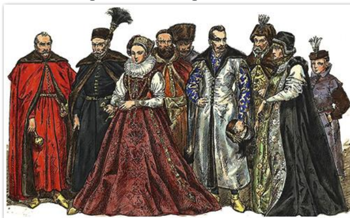
Представители магнатории Великого Княжества Литовского. Гравюра Яна Матейко. Около 1875 г.

В политической жизни ВКЛ и Королевства Польского ведущая роль постепенно стала принадлежать шляхте. С 1566 г. она регулярно собиралась на поветовые сеймики, выбирала своих представителей на вальный сейм.