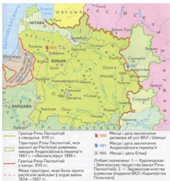
Великое Княжество Литовское во второй половине XVII ст.

Силы были неравными, Речь Посполитая уступала России в количестве отрядов. Армия московского царя насчитывала около 100 тыс. человек и состояла из трех группировок (Шереметьева, Черкасского и Трубецкого). Алексею Михайловичу помогали запорожские казаки во главе с Иваном Золоторенко. Армия ВКЛ вообще не была готова к войне. Гетман Януш Радзивилл собрал всего около 10 тыс. человек шляхетского ополчения и наемников.