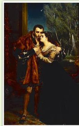
Портрет Сигизмунда II Августа и Барбары Радзивилл во дворце в Вильне. Художник Ян Матейко. 1867 г.

Барбара Радзивилл (1520—1551) — великая княгиня литовская и королева польская, жена Сигизмунда II Августа. Дочь гетмана великого литовского Юрия Радзивилла. Получила хорошее образование. После смерти первого мужа Станислава Гаштольда переселилась в Вильну к своему брату Николаю. В это время там находилась резиденция Сигизмунда II Августа, который после знакомства с Барбарой начал с ней встречаться. Чувства великого князя к Барбаре стремились использовать для укрепления собственных позиций Николай Радзивилл Рыжий и двоюродный брат Барбары Николай Радзивилл Черный. Под их давлением в 1547 г. в Вильне состоялось тайное венчание Барбары с Сигизмундом II Августом. Но против этого брака выступили магнаты и многочисленная знать, недовольная ростом влияния Радзивиллов и унижением королевского достоинства неравным браком. Решительно против Барбары была настроена свекровь, королева Бона Сфорца. Барбара была коронована в Кракове 7 декабря 1550 г., но в скором времени умерла. Некоторые историки считают, что ее отравили. Похоронена Барбара Радзивилл в Виленском кафедральном соборе в королевской усыпальнице.