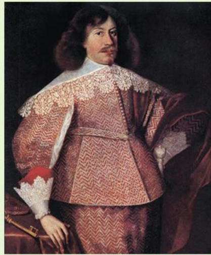
Януш Радзивилл. Художник Бартоломей Стробель. 1634 г.

Охарактеризуйте личность Януша Радзивилла. Сочините синквейн.