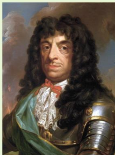
Ян II Казимир.

Какие причины, по вашему мнению, заставили короля отречься от престола?