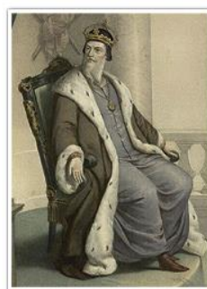
Сигизмунд II Август. Художник Антуан Маурин. XIX в.