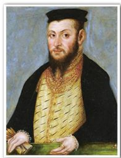
Сигизмунд II Август. Художник Лукас Кранах Младший. Около 1553 г.

В Польше ситуация была иной. Там шляхта имела равные права с представителями магнатских родов. Подобный пример побуждал шляхтичей Великого Княжества Литовского добиваться одинаковых прав с польской шляхтой путем заключения унии. Это они откровенно высказали великому князю и королю Сигизмунду II Августу на полевом сейме под Витебском в 1562 г.