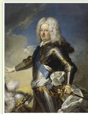
Станислав Лещинский. Художник Жан Батист ван Лоо. 1727—1728 гг.

Среди шляхты большой популярностью пользовался Станислав Лещинский. Его избрали на престол на сейме 1733 г. Но это не устроило Россию и Австрию. Россия направила войска в Речь Посполитую. Станислав Лещинский бежал в Гданьск. Город был осажден русскими войсками и капитулировал. Основные военные действия произошли на территории Польши, Германии, Австрии и Италии. Мирный договор был подписан в 1738 г. в Вене. По его условиям Станислав Лещинский отрекся от престола. Новым монархом признали Августа III (1734—1763 гг.).