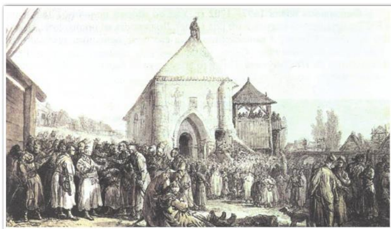
Сеймик перед костелом. Художник Ян Норблин. XVIII в.