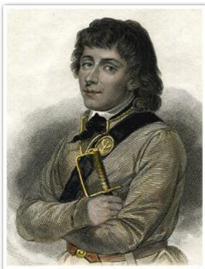
Тадеуш Костюшко. Художник Иосиф Грасси. 1840 г.

Прогрессивная часть шляхты попыталась сохранить государственную самостоятельность страны, воссоздать Речь Посполитую в границах 1772 г. 24 марта 1794 г. началось освободительное восстание. Его руководителем стал генерал Тадеуш Костюшко .