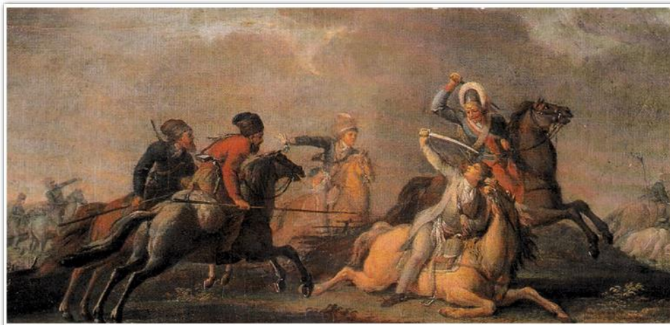
Ранение и взятие в плен Костюшко в битве под Мацеёвицами. Художник Ян Богумил Плерш. 1794 г.

Тадеуш Костюшко (1746—1817) родился в семье шляхтича в фольварке Меречёвщина около м. Косово Слонимского повета. Учился в Варшавском кадетском корпусе, а затем во Франции. Там он познакомился с идеями французских просветителей. В 1776 г. уехал в Америку, где принял активное участие в войне за независимость США. Вернувшись в 1784 г. на родину, он включился в патриотическое движение.