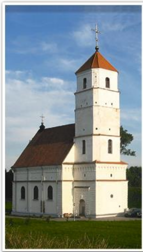
Бывший кальвинский сбор в Заславле

Протестантские общины в ВКЛ возникли в первой половине XVI в.