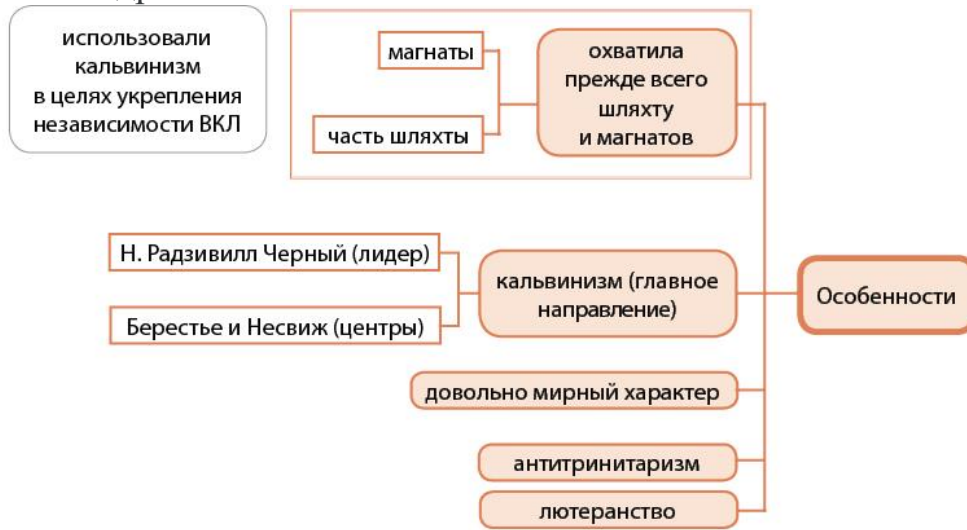
Особенности развития Реформации на белорусских землях

подразделялся на несколько течений: лютеранство , англиканство , кальвинизм и др.