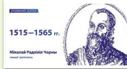
Билборд с изображением Николая Радзивилла Черного. Проект «Родные даты». 2014 г.

Участвовал в определении политики государства. Способствовал браку своей кузины Барбары с великим князем литовским Сигизмундом II Августом. Занимал должности маршалка земского, канцлера ВКЛ, воеводы виленского. Поддерживал политический союз ВКЛ с Польшей, однако был противником федерации с ней, отстаивал суверенитет ВКЛ. После отъезда Сигизмунда II Августа в Польшу (1561 г.) был объявлен наместником великого князя в ВКЛ. Николай Радзивилл Черный возглавил реформационное движение в ВКЛ. В начале 1550-х гг. он присоединился к лютеранской церкви, но через 2 года перешел в более радикальное течение протестантизма — кальвинизм. При нем Берестье и Несвиж стали центрами протестантизма в Беларуси. Он открыл первую на территории Беларуси типографию. Под его контролем в 1557 г. состоялся первый съезд протестантов в Вильне. Была основана Литовская провинция кальвинистской церкви. Руководил ее делами провинциальный синод. В 1560-е гг., во время наивысшего подъема Реформации, в Беларуси действовало около 90 сборов (культовых учреждений). В кальвинизм переходили магнаты и шляхта. Значительно активизировалась духовная жизнь, возросла роль просвещения, книгопечатания, широко стали известны ренессансные идеи, налаживались международные контакты.