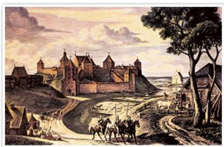
Реконструкция Новгородского замка. Художник Виктор Стащеньюк

Одним из самых крупных военных комплексов подобного рода являлся Новгородский замок, созданный на месте деревянного укрепления XI в. Замок имел семь башен. С юго-западной стороны его окружала система рвов и валов. За стенами находился ряд жилых и хозяйственных построек, храм и княжеский дворец. Исследователи считают, что комплекс использовался как резиденция.