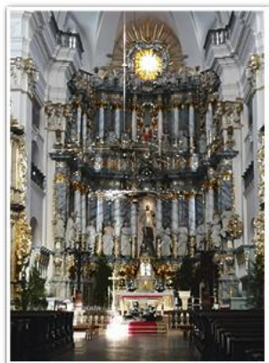
20-метровый центральный алтарь костела Франциска Ксаверия в Городне (1736 г). Дерево, тонированное под мрамор (современный вид)