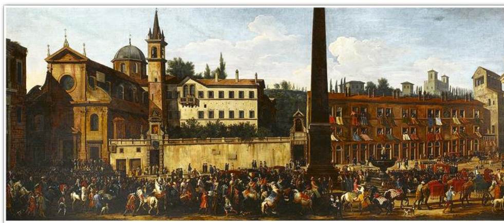
Въезд Михала Казимира Радзивилла в Рим в 1680 году. Художники Питер ван Блумен, Никколо Кадацци. Конец XVII в.

Батальный жанр в изобразительном искусстве представлял знаковую битву или событие дипломатического характера — например, «Въезд Михала Казимира Радзивилла в Рим в 1680 году», со стремлением представить изображаемое как можно подробнее. Для таких произведений была характерна прорисовка не только основных действующих лиц, но также природы и окружающей обстановки.