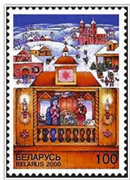
Батлейка. Марка. 2000 г.

На территории Беларуси активно развивался школьный театр. Он происходил от школярских и студенческих постановок на религиозные темы. Постановки организовывали учащиеся католических и униатских коллегиумов, протестантских школ. Но и ученики православных школ не отказывались от участия в подобных зрелищах. Сюжеты создавались на евангельские, ветхозаветные или античные темы, а при их раскрытии использовалось многоязычие (латынь, польский, старобелорусский языки).