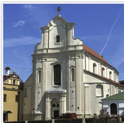
Костел Святого Иосифа. Менск. 1652 г. (современный вид)