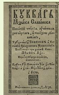
Евьевский букварь. 1618 г.

В 2016 году белорусские ученые обратили внимание на экземпляр букваря, который сейчас находится в Лондоне, а напечатан был в Евье в 1618 г. Дело в том, что до последнего времени ученые считали первым белорусским букварем издание Спиридона Соболя. Букварь Соболя увидел свет в 1631 г. в типографии Кутейнского монастыря и имел название «Букварь сиречь начало учения детям, начинающим чтению извыкати». О существовании еще более раннего букваря было известно по косвенным сведениям английских библиографов, но проверить достоверность упомянутого факта не удавалось. «Евьевский букварь» 1618 г. хранится в закрытом для внешнего мира собрании лондонских баристов (корпорации адвокатов). К 400-летию юбилею он был издан факсимильным изданием Национальной библиотекой Беларуси.